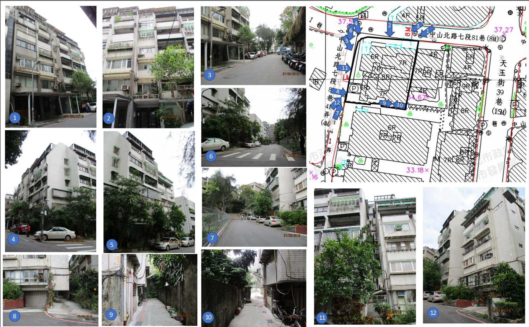
圖3-2：更新單元內土地使用現況圖