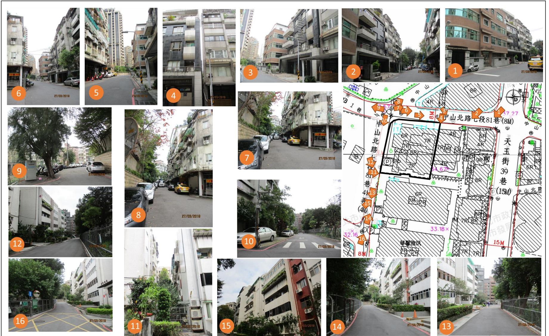
圖3-3：更新單元周圍土地使用現況圖